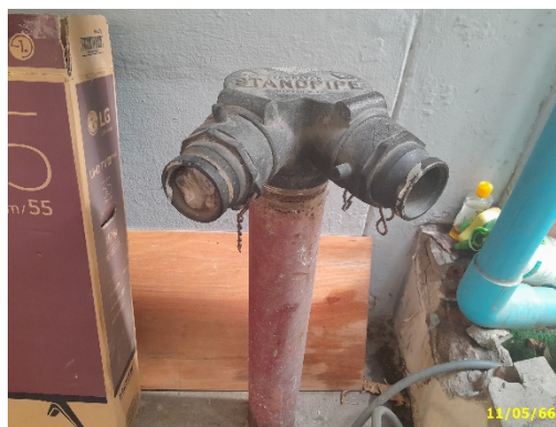
จุดเชื่อมต่อดับเพลิง