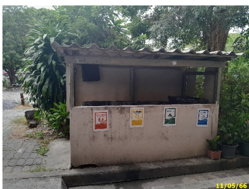
ถังรองรับมูลฝอยอาคาร