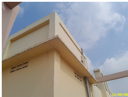
ถังสำรองน้ำใช้ชั้นดาดฟ้า