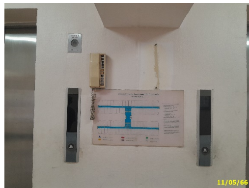
แผนผังการหนีไฟ