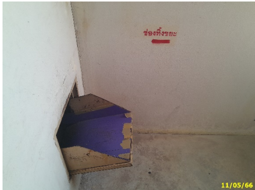
ช่องทิ้งมูลฝอยประจำชั้นของอาคาร

โครงการมีช่องทิ้งมูลฝอย สำหรับทิ้งมูลฝอยจากชั้นต่างๆ ลงมาสู่ห้องพักมูลฝอยของแต่ละอาคาร โดยห้องของแต่ละอาคารจะมีประตูปิดมิดชิด และในแต่ละวัน โดยช่วงเวลา 8.00-17.00 น. โครงการจะมีพนักงานทำการคัดแยก เพื่อรอรถเก็บขนมูลฝอยของสำนักงานเขตวังทองหลางเข้ามาทำการจัดเก็บทุกๆ 3 วัน ซึ่งหลังการเก็บขนพนักงานทำความสะอาดของโครงการจะทำความสะอาดอย่างสม่ำเสมอ แสดงดังภาพที่ 1.3.5-1