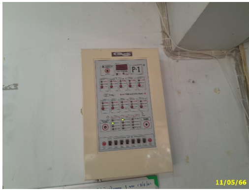
แผงควบคุม