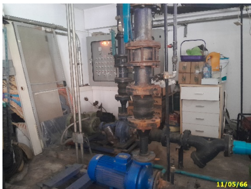
ปั๊มสูบน้ำชั้นใต้ดิน