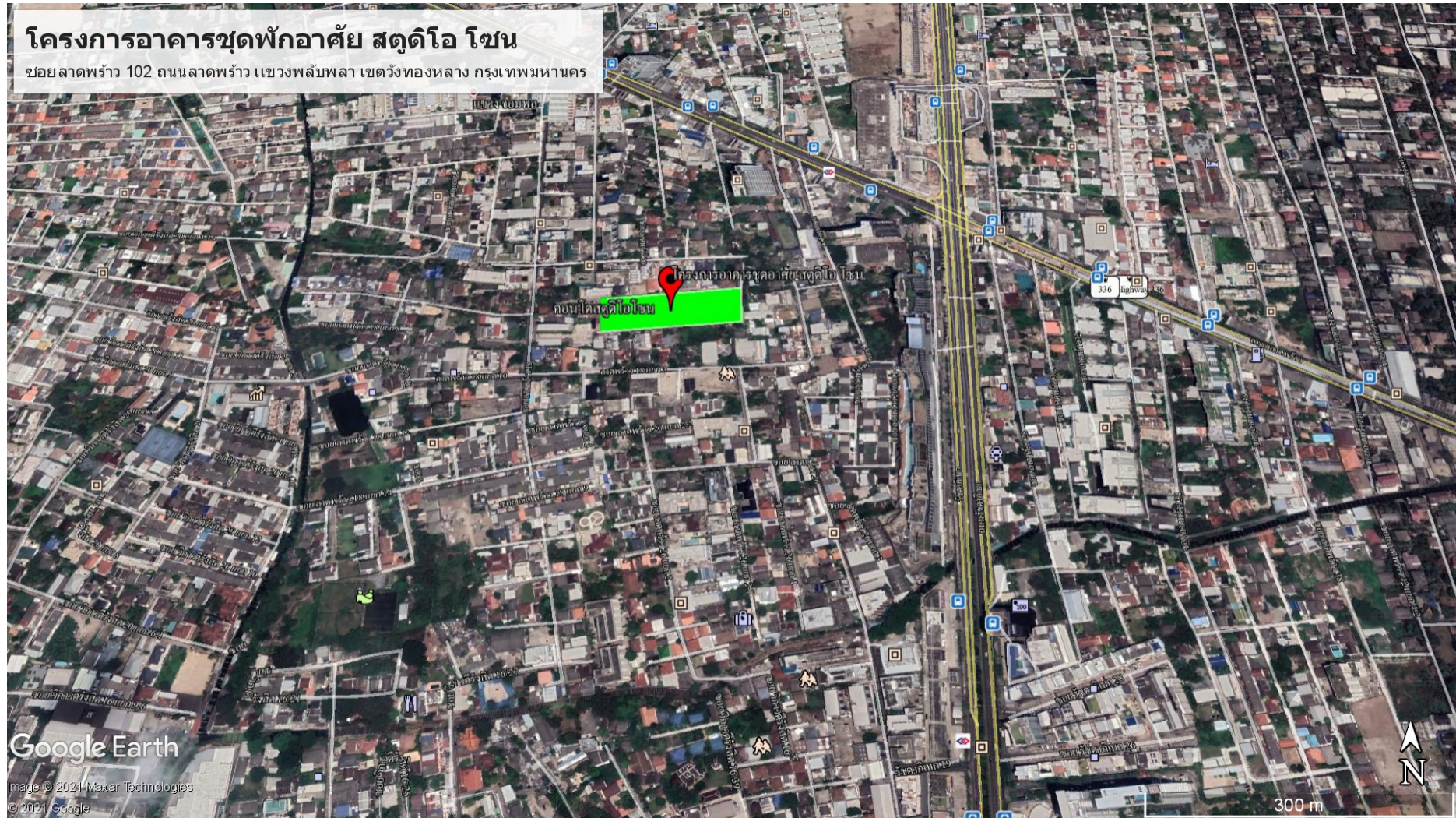
ภาพที่ 1.2-1 ที่ตั้งโครงการ