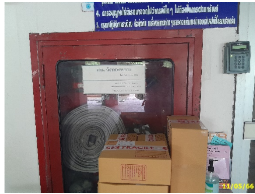
ตู้ดับเพลิงพร้อมหัวฉีด พร้อมอุปกรณ์