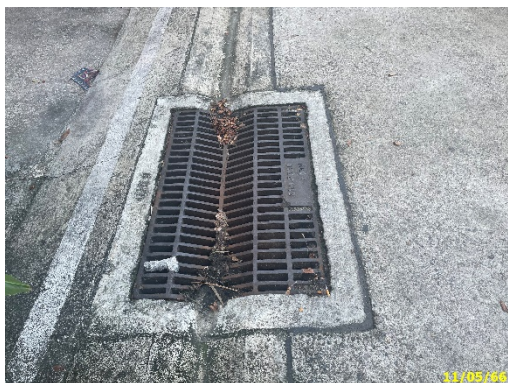
ท่อระบายน้ำออกสู่สาธารณะ

ปัจจุบันโครงการมีท่อระบายน้ำไว้รอบพื้นที่โครงการ เพื่อระบายน้ำออกจากพื้นที่โครงการลงสู่คลองเจ้าคุณสิงห์ และได้มีการทำความสะอาดเป็นประจำ แสดงดังภาพที่ 1.3.4-1