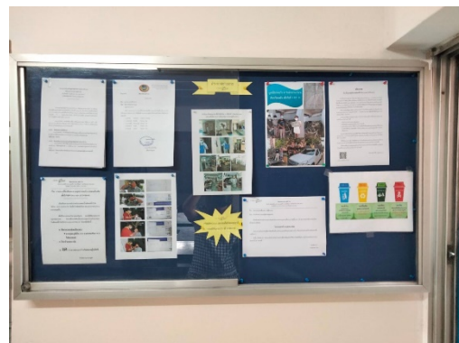
ป้ายรณรงค์การคัดแยกมูลฝอยก่อนทิ้ง