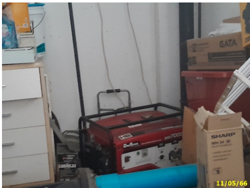
เครื่องปั่นไฟฉุกเฉิน