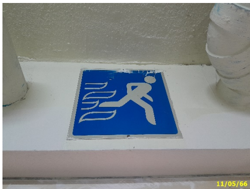
บันไดหนีไฟ