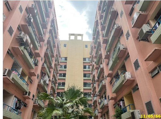
ภาพที่ 1.2-2 สภาพโครงการปัจจุบัน