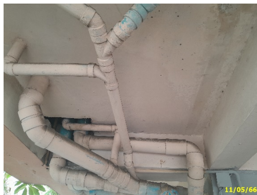
ท่อรวบรวมน้ำ