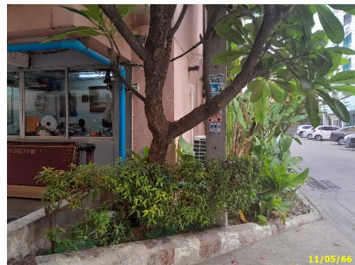
พื้นที่สีเขียวชั้นล่าง