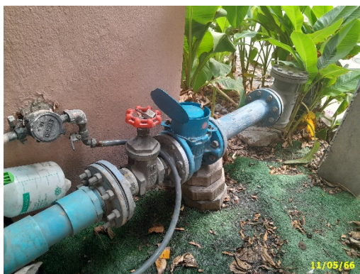
จุดเชื่อมต่อประปา

ปัจจุบันโครงการอาคารชุดพักอาศัย สตูดิโอ โซน มีการรับน้ำประปาจากการประปานครหลวง สาขา ลาดพร้าว เฉลี่ย 145 ลูกบาศก์เมตร/วัน โดยนำมาเก็บในถังสำรองน้ำชั้นใต้ดินของโครงการ จำนวน 1 ถัง/อาคาร จากนั้นโครงการได้ทำการสูบไปเก็บไว้ในถังสำรองน้ำใช้ชั้นดาดฟ้า จำนวน 1 ถัง/อาคาร และทำการจ่ายน้ำไปยังห้องผู้พักอาศัยภายในโครงการอย่างเพียงพอ แสดงดังภาพที่ 1.3.2-1