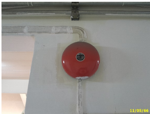
สัญญาณกริ่งเตือนภัย