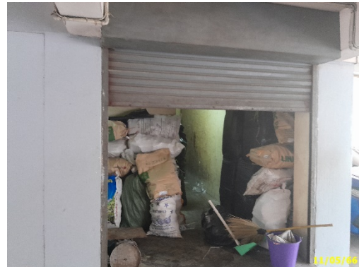
ห้องพักมูลฝอยรวม