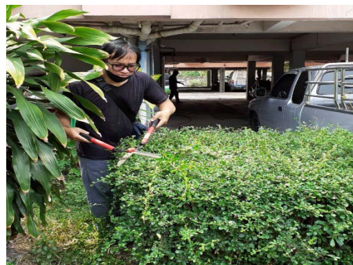
ดูแลพื้นที่สีเขียว