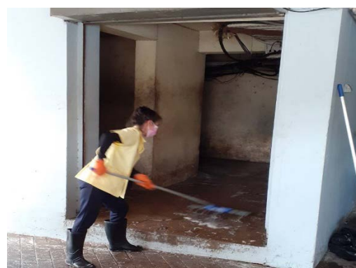
ทำความสะอาดหลังการเก็บขน