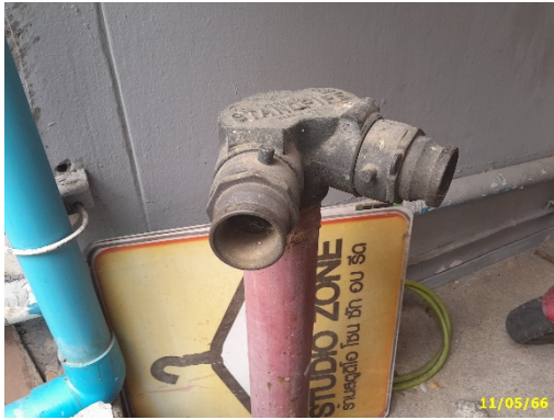
หัวรับน้ำดับเพลิง