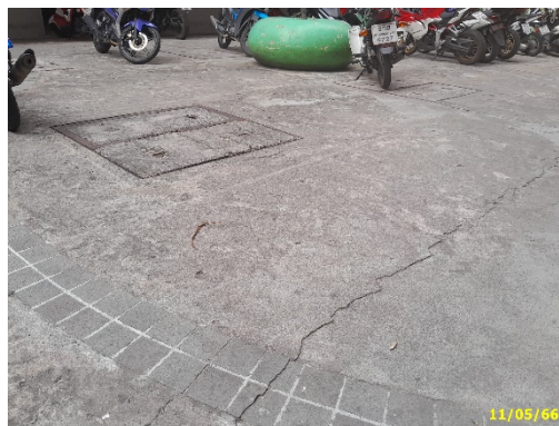
พื้นที่ตั้งระบบบำบัดน้ำเสีย