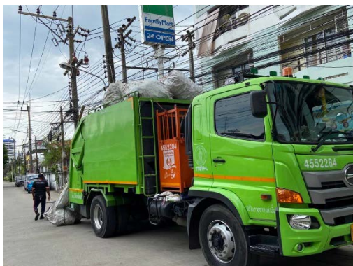
รถจากสำนักงานเขตเข้ามาเก็บขน