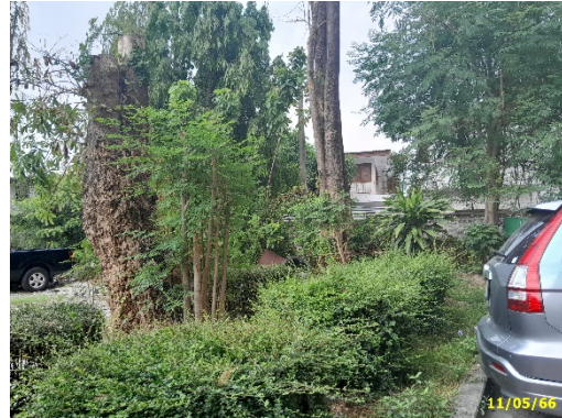
พื้นที่สีเขียวชั้นล่าง (ต่อ)