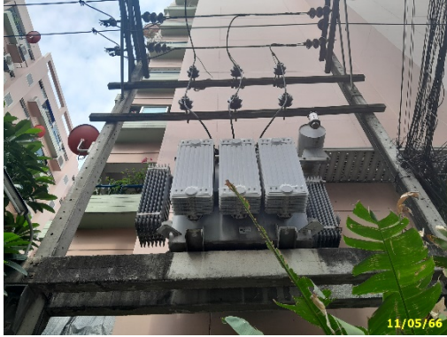
หม้อแปลงไฟฟ้าโครงการ

โครงการมีการใช้ไฟฟ้า โดยระบบไฟฟ้าป้อนไฟฟ้าจากไฟฟ้านครหลวงเขตธนวจันทร และมีติดตั้งระบบไฟฟ้าฉุกเฉิน ซึ่งใช้เป็นเครื่องปั่นไฟสามารถสำรองไฟได้เพียงพอ แสดงดังภาพที่ 1.3.6-1